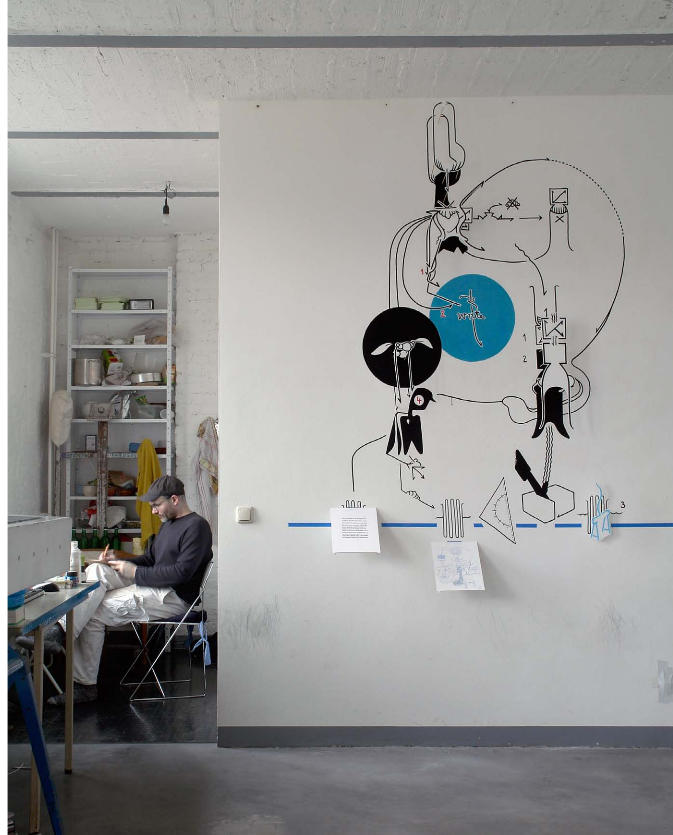
Der Zeichner zeichnet. Wandzeichnung mit darin integrierter Auftragszeichnung und Auftragstext sowie einem am Küchentisch zeichnenden Zeichner. Atelier Berlin 2009