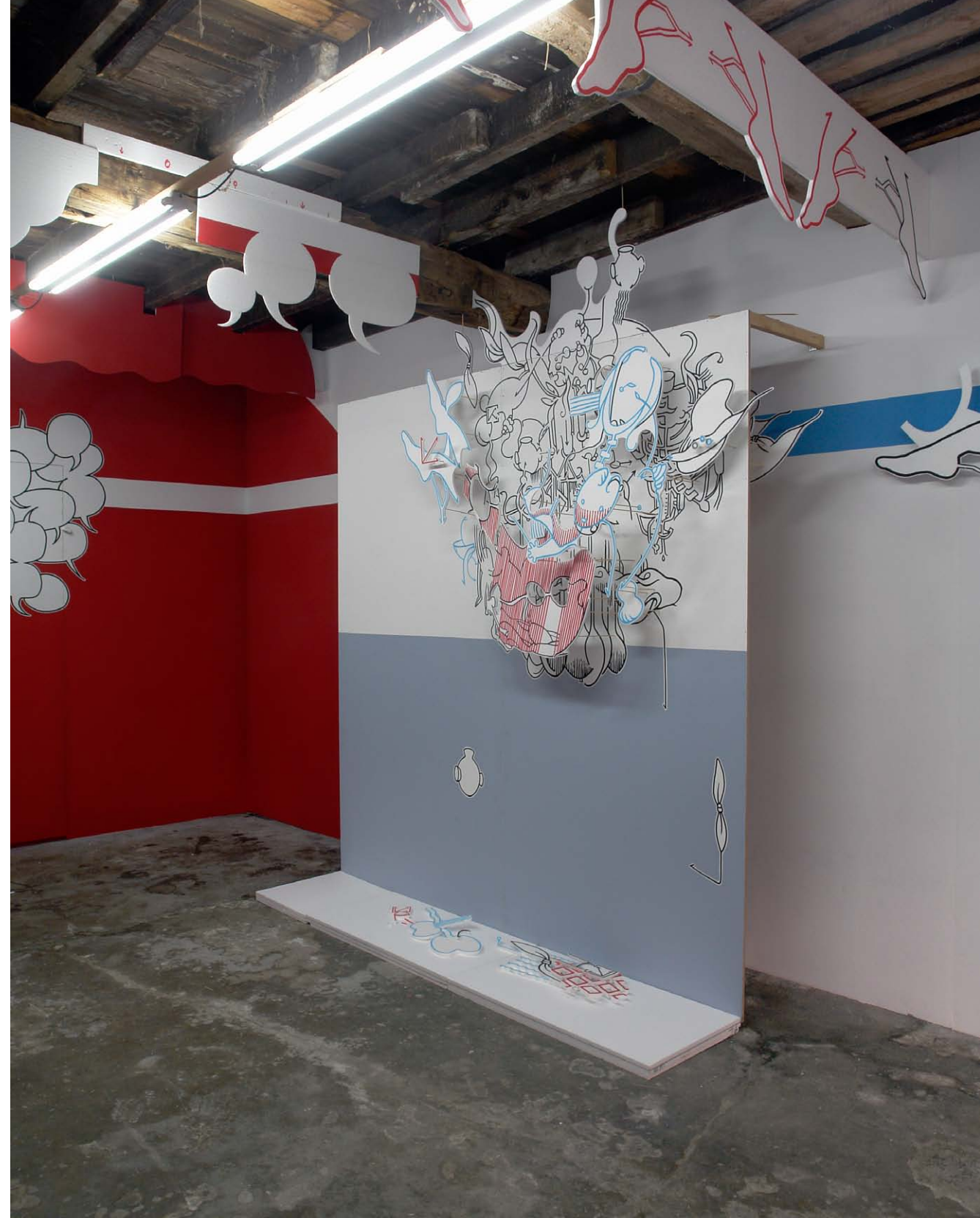
Tageszeichnung vom 27.12.2007 (Abb. links), Paar II (Version 2). Detail der Raumzeichnung Die Ewigkeit der Ideologie, Kunstverein Diepenheim (Ottenhuis), Holland 2009 (Abb. rechts)